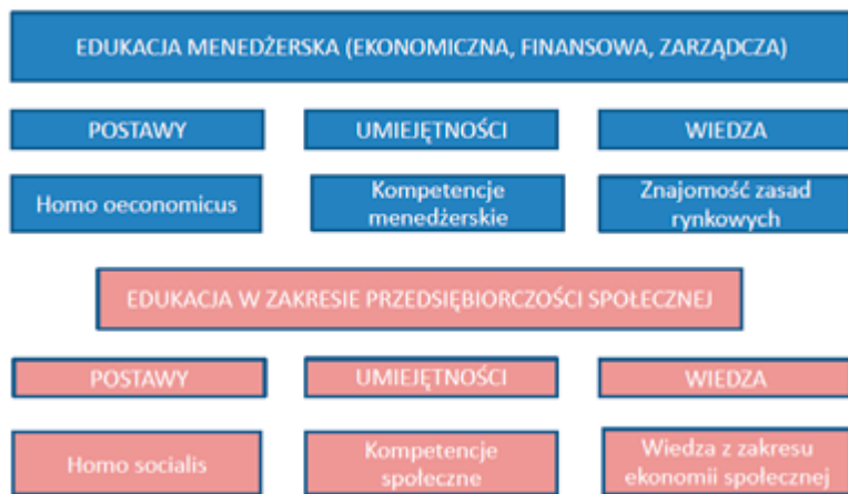
Rysunek 2. Edukacja na rzecz przedsiębiorczości na studiach biznesowych.

Tego typu model edukacji na rzecz przedsiębiorczości lub przez przedsiębiorczość możliwy jest na każdym poziomie studiów, w tym w ramach programów MBA. Na najlepszych uczelniach amerykańskich realizowane są pełne curricula z zakresu przedsiębiorczości społecznej, a ich ocena znajduje odzwierciedlenie w rankingach dotyczących tego typu programów (Burke, 2018). Niewątpliwie, takie podejście wymagałoby odpowiedniego przygotowania nauczycieli przedmiotu, to jednak nie powinno stanowić wielkiego wyzwania.