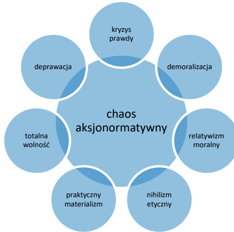
Schemat 2. Przejawy chaosu aksjonormatywnego.