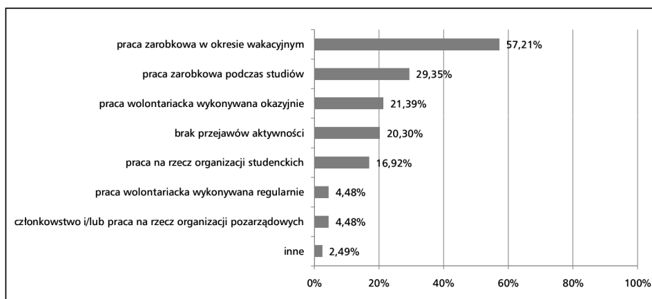
Wykres 1. Obszary aktywności społecznej studentów