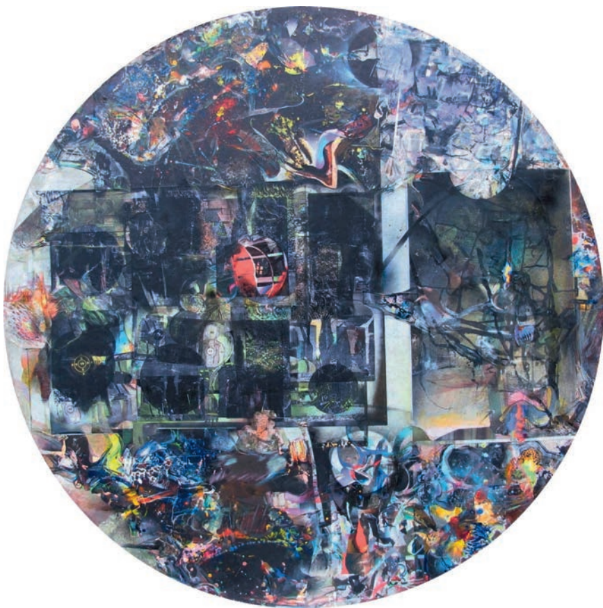
Okno III, 2009, akryl, olej i autocollage na drewnie, ø 150 cm