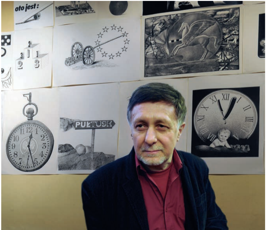
Ersatzgrafica w tle, Vis-à-Vis, Rynek Główny, Kraków, marzec 2012