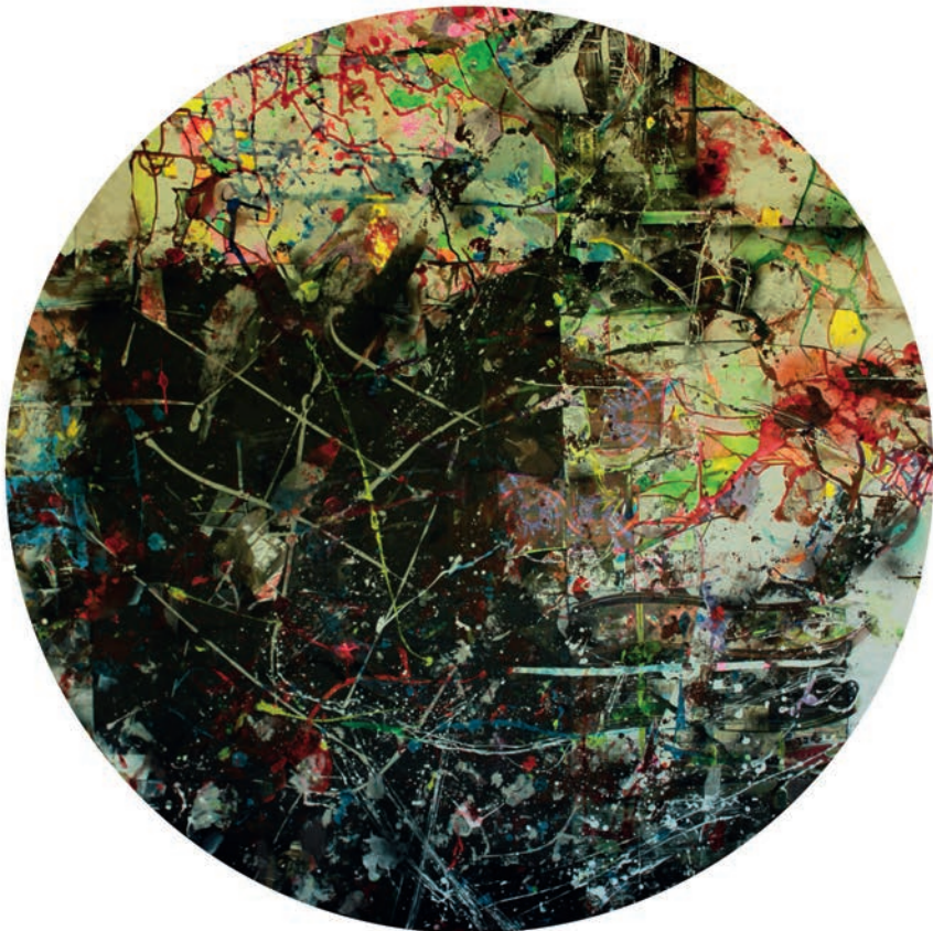
Oka-mgnienie XXXI, 2012, tusz, akryl i collage na papierze, ø 140 cm