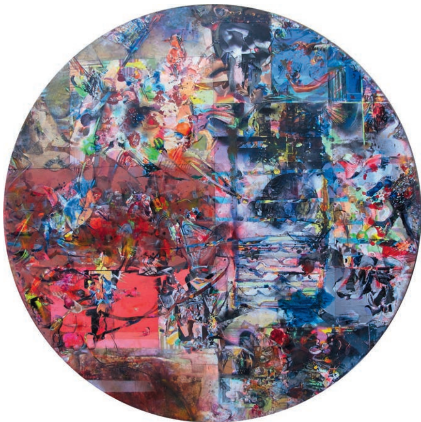
Okno I, 2009, akryl, olej i autocollage na drewnie, ø 150 cm