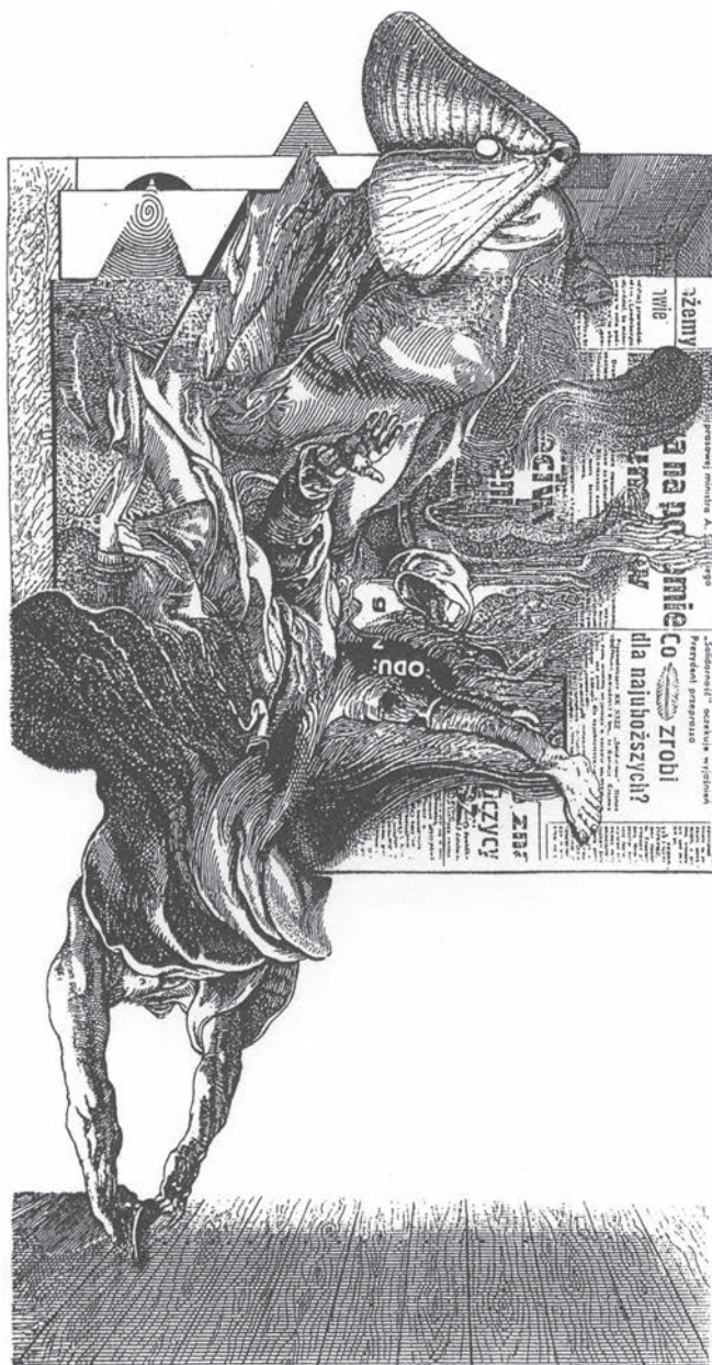
Ersatzgrafica nr 428