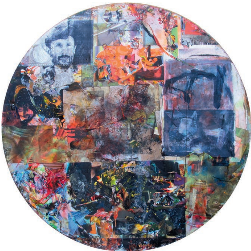
Okno II, 2009, akryl, olej i autocollage na drewnie, ø 150 cm