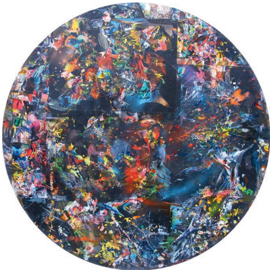
Okno IV, 2009, akryl, olej i autocollage na drewnie, ø 150 cm