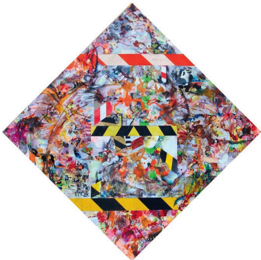
Topos XII, 2009, akryl, olej i autcollage na drewnie, 150 x 150 cm